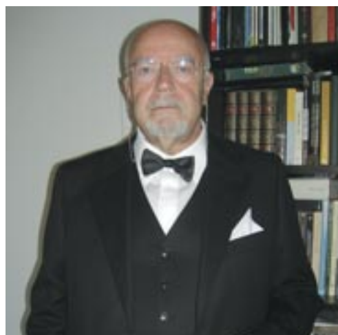
di Hervé Cavallera

Criminalità e violenza. La possibilità di uscire dal guazzabuglio esistenziale del presente non può che trovarsi nella riconsiderazione delle competenze e nel rispetto del prossimo