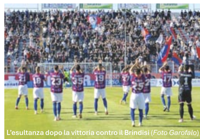
L'esultanza dopo la vittoria contro il Brindisi

ORO E ARGENTO CIFRE RECORD SUPERVALUTIAMO I TUOI PREZIOSI