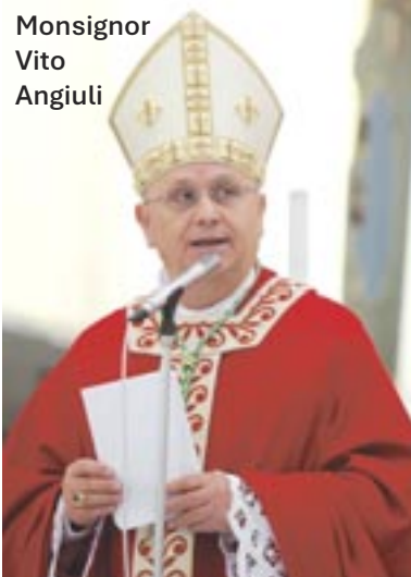
Monsignor Vito Angiuli

Il senso del Natale. «Consiglierei a tutti, credenti e non credenti, di vivere la gioia della festa, come momento per uscire dall'individualismo e intrecciare rapporti umani più profondi e sinceri»