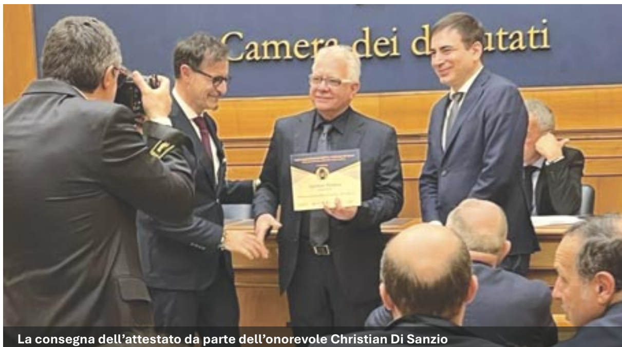
La consegna dell'attestato da parte dell'onorevole Christian Di Sanzio

Branca attraverso i suoi riconoscimenti, racconta l'Italia, le sue eccellenze, la cultura e l'unicità del nostro Paese a 360°, la storia di coloro che contribuiscono a diffonderla oltre confine, l'indiscusso talento italiano ed il bello che ci contraddistingue nel mondo.