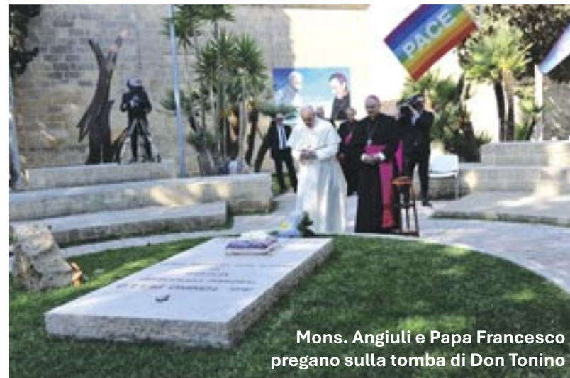
Mons. Angiuli e Papa Francesco pregano sulla tomba di Don Tonino

Sud ha riacquisito una sua importanza. Bisognerebbe, pertanto, cogliere il valore delle trasformazioni in atto e assecondare il corso degli eventi per uno sviluppo economico, sociale e culturale dell'intero territorio. Sotto questo profilo, noto un atteggiamento ambivalente. Se da una parte, si manifesta una nuova forza propulsiva e una rinnovata capacità imprenditoriale, dall'altra rimangono ancora irrisolte alcune questioni in riferimento alla necessità di migliorare le infrastrutture necessarie per un vero sviluppo e soprattutto a promuovere un cambio di passo di tipo culturale. Mi riferisco alla necessità di "fare rete" e di lavorare con una visione più condivisa e una programmazione più generale aperta al bene comune superando la perdurante