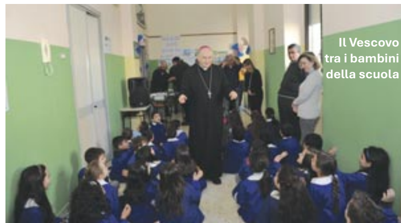
Il Vescovo tra i bambini della scuola

Mentre sarebbe auspicabile che, in sintonia con il messaggio più profondo delle feste natalizie, si privilegiassero altri aspetti: la